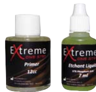
Extreme One Step primer