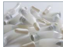
Extreme One Step compules refill