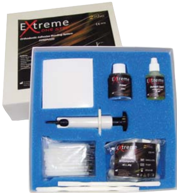
Extreme One Step Kit capsule

Auto Curing composite for bonding metal and ceramic brackets. The highly filled paste features a tacky viscosity that flows well and eliminates brackets flotation. The catalyst system sets on contact and gets maximum strength within five minutes.