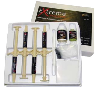
Extreme One Step Kit syringe